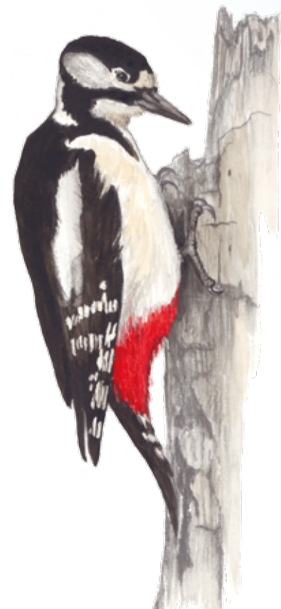
Större hackspett ( Dendrocopos major ), här en hona, trivs bland döende och döda trädstammar med mycket insekter. Greater spotted woodpecker

Vingslag och stjärtslag De döda eller döende träden blir mat och skydd för många småkryp och deras larver. Bordet är dukat för fladdermöss och fåglar. Hackspettar förstorar håligheter till sina bon som när de överges kan tas över av skogsduvor eller fladdermöss. I områdets västligaste del planeras en damm och en översilningsmark som lekplats för fisk, bland annat gädda som leker i mars-april.