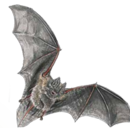
Den ovanliga fladdermusarten barbastell ( Barbastella barbastellus ) har sina jaktmarker i reservatet. Barbastelle bat