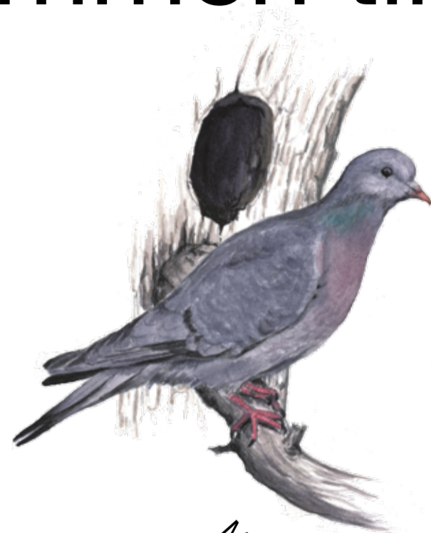
Skogsduva ( Columba oenas ) behöver gamla träd med spillkråkhål att häcka i. Stock dove